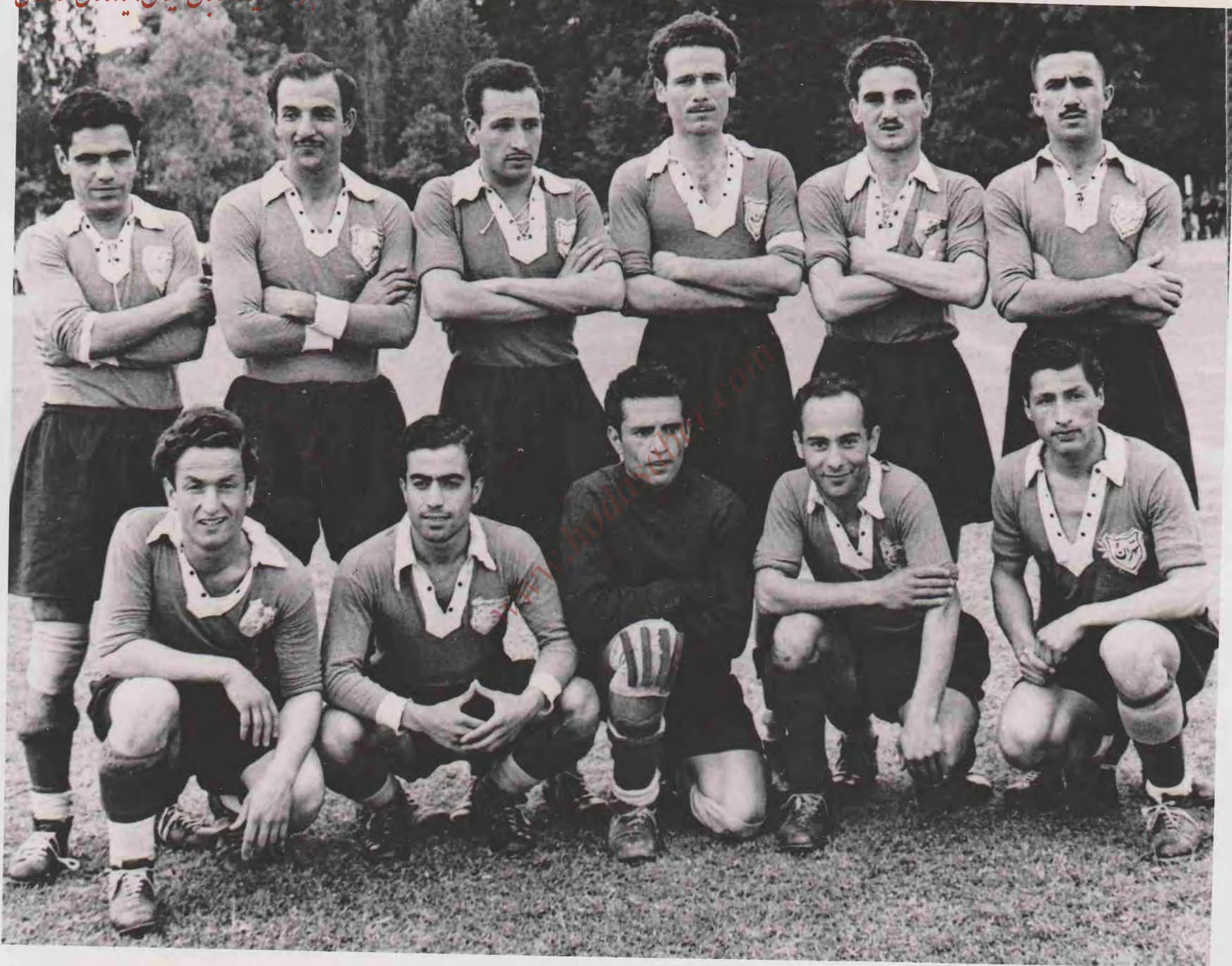
هزار تصویر فوتبال ایران؛ یادگاری از عهدی صابر