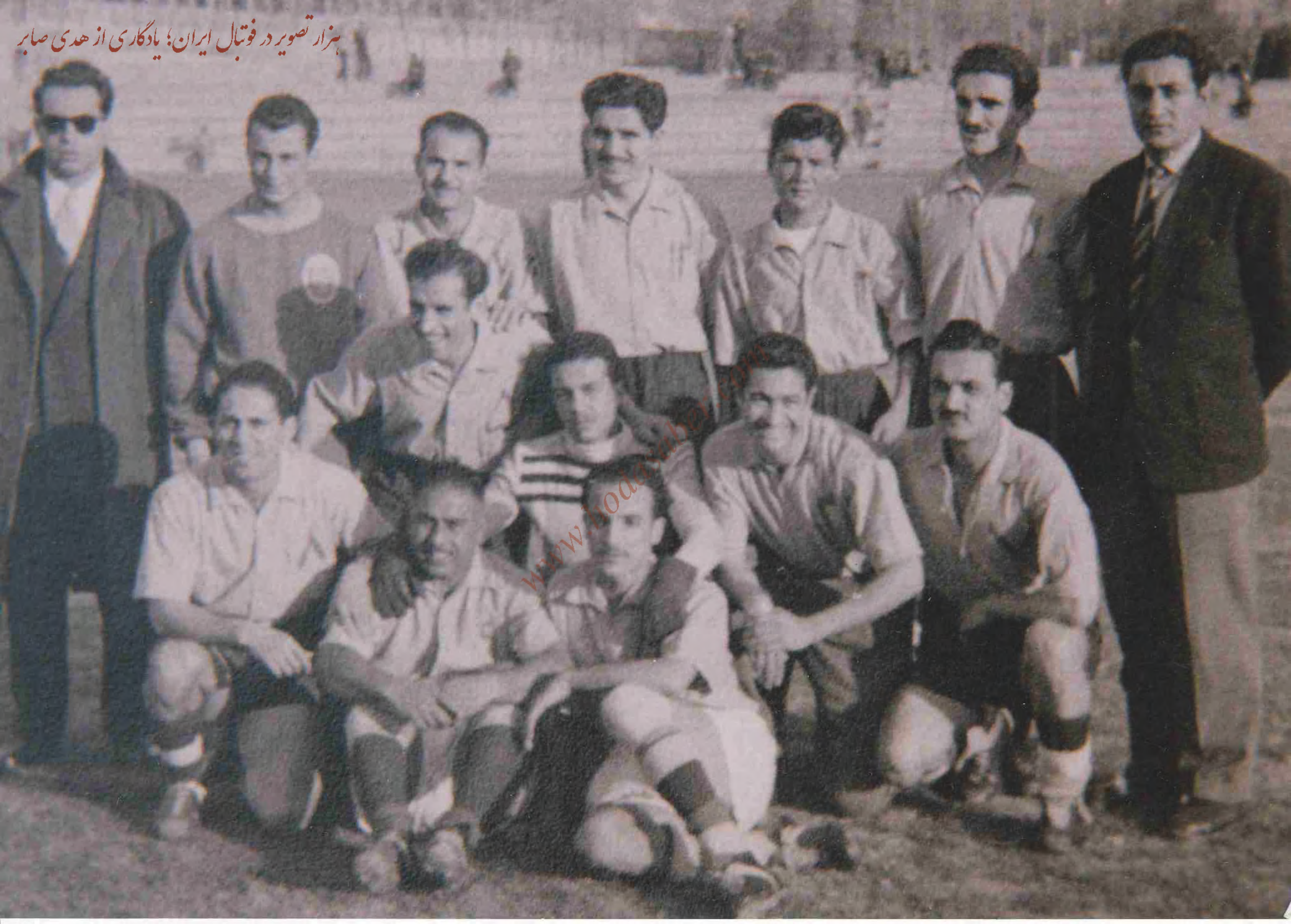
هزار تصویر در فوتبال ایران؛ یادگاری از مهدی صابر