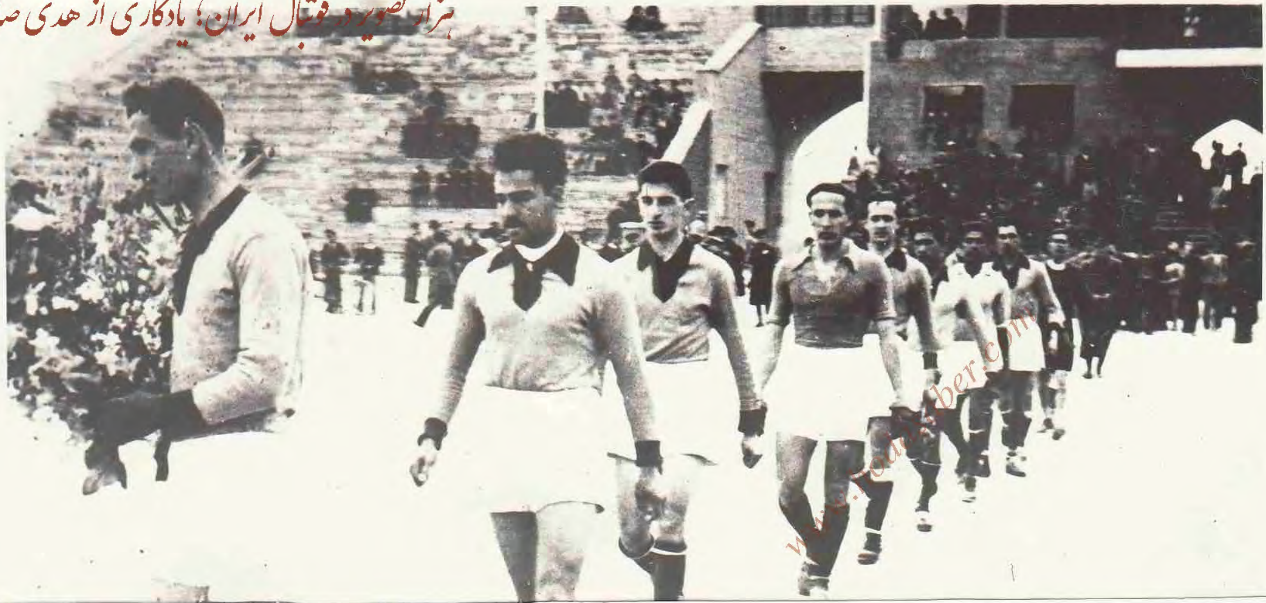
تصویر شماره . تیم فوتبال کرهستان هنگام ورود به میدان