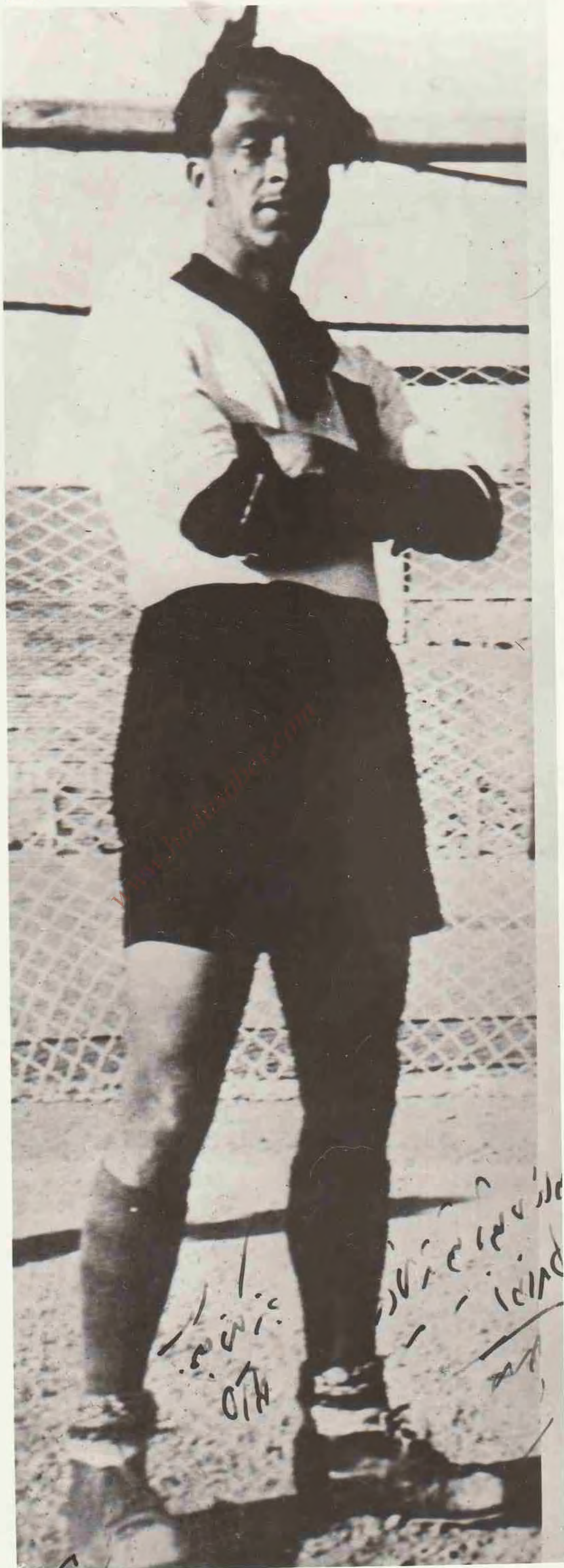
هزار تصویر در فوتبال ایران؛ یادگاری از حدی صابر